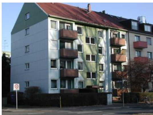
wels-0512c (2) Wohnung Welsersstr. unten rechts