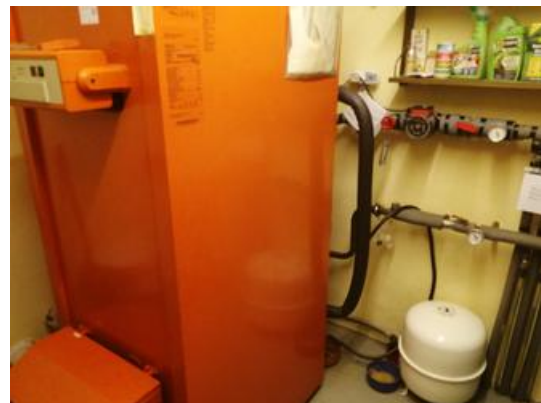
201029 Heizung Viessmann Kessel 2000