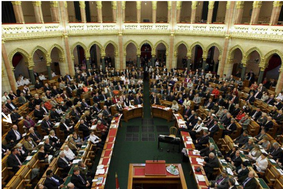
Bild: par2 101022 (8) ich sitze hier links in der 5. Reihe am Rand (siehe weißes Pfeil)

Was mir noch als besonderes Ereignis einfällt ist, dass wir 2014 im ungarischen Parlament eine Feier im Zusammenhang mit unserer Schule in Kastl hatten, an dieser Feier habe ich teilgenommen.