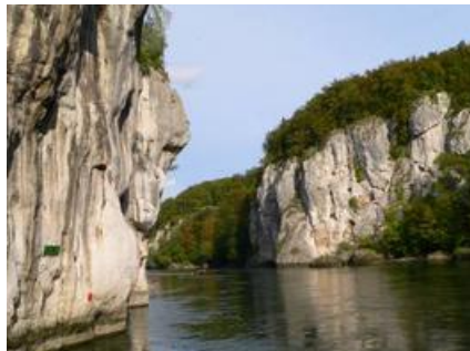
1102c5- Boot Weltenburg Kelheim

Der Donaudurchbruch bei Weltenburg ist von Regensburg aus bis hierhin schiffbar. Das Kloster hat im Innenhof ein Restaurant mit bayrischen Spezialitäten und