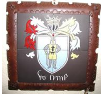
1c7 Wappen Rimler Cimer