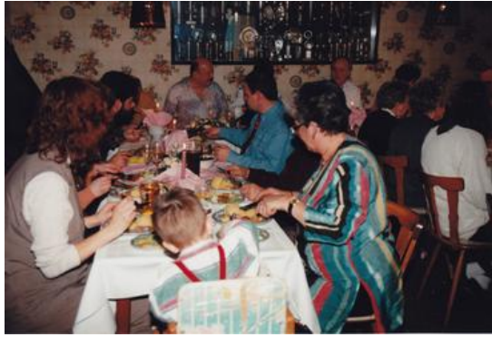
1995eg (1) Jan 7 In Boxford Emil 50 Jahre