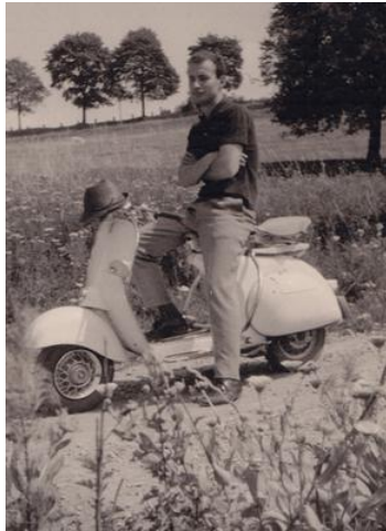
1957ks (12) Vespa Emil 1963