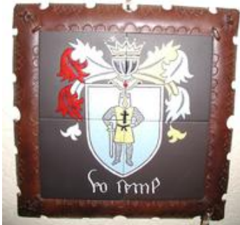
1c7 Wappen Rimler Cimer