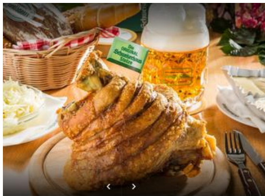
1998-Wien Prater Stelze

Jahrelang bin ich für ein paar Tage nach Wien gefahren, um dort etwas anzuschauen, ich liebe diese Stadt. Ich war zwar dort zwischen 1957 und 1959 im Internat, dann 1973 mehrere Monate zur Inbetriebsetzung des Kraftwerks Donaustadt. Ich war gern im Schweizer Haus im Prater, um eine Stelze zu essen, war auch in Grinzing, habe aber auch Schönbrunn, die Belvedere, die Burg, Kaffe Demel usw. besucht.