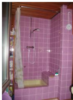
0105b-25 Bad Dusche

Ich hoffe, diese Bilder helfen, sich ein Bild davon zu verschaffen, wie wir in Großgrundlach, einem Vorort von Nürnberg, nah an Fürth und Erlangen, in einem kleinen Haus gewohnt haben.