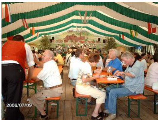
0607a (23) Bierzelt 2006

Vom Frühjahr bis Herbst habe ich die Bierzelte in der Nähe von Großgrundlach für ein Maß Bier aufgesucht, es gab fast jedes Wochenende eine Kirchweih in unserer Umgebung. Ich mochte die Musik und natürlich das Bier. Am schönsten war die Kirchweih in Gr., weil ich da hinlaufen konnte, ansonsten musste ich mit dem Fahrrad fahren.