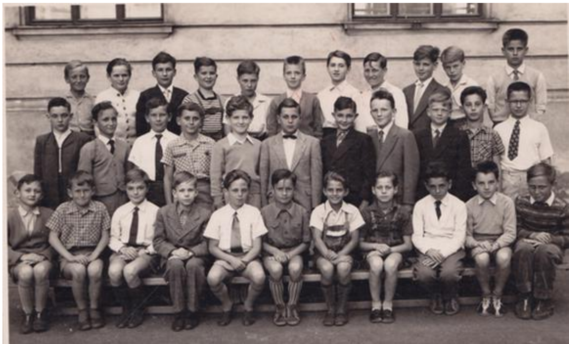
1956wi (2) Klassenfoto, ich bin der dritte links in der letzten Reihe, das Bild ist 1958 entstanden