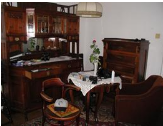
0110e2 Schrank Debrecen Pirooska

Links das Haus in der Albert utca, wo sich meine Wohnung im ersten Stock befindet. Rechts der Wohnzimmerschrank aus Debrecen und die Stühle, Tisch und Vitrine aus Baja, alles aus dem Erbe meiner Großeltern.