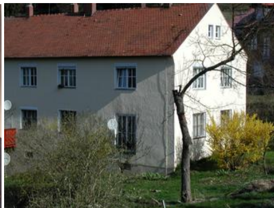
0104b09 Kastl am Hochholz