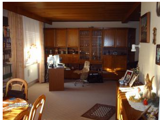
grl-0612d (19) Wohnzimmer