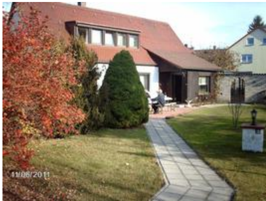
1111a (8) Grl unser Haus mit Eingang