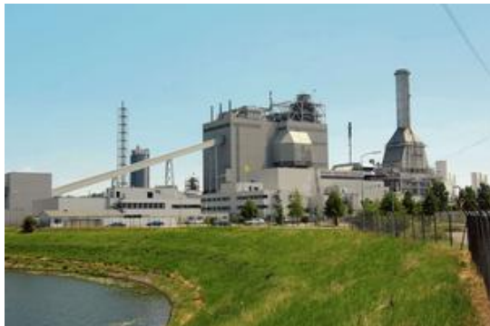
Buggenum 1908bg Kraftwerk in Holland

Das war sehr interessant, weil ich nicht nur die touristischen Attraktionen kennengelernt habe, sondern auch die Menschen in ihren Lebenssituationen.