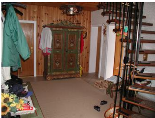
0105b-11 Eingang, Diele