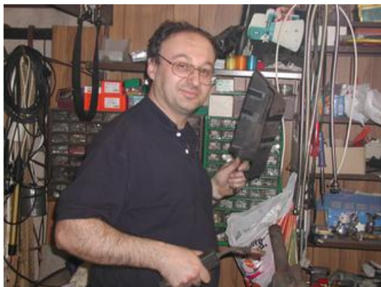
0205ds5 Oli Garage Schweißen 2002

Neben der Garage ist eine kleine Werkstatt, wo wir sehr viel reparieren können, eins unserer Lieblingsbeschäftigungen ist schweißen. Rechts der Heizraum mit den genannten Heizrohren.