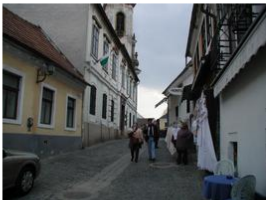
0804d (10) Weg zum Marktplatz Durch diese schmale Gasse ging der gesamte Verkehr einspurig von Budapest nach Visegrad, unglaublich wie wenig auf der Straße los war

Das Brauchwasser wurde mit einer Pumpe in einen Tank auf dem Dachboden befördert, von hier hatten wir dann fließendes Wasser im Haus, die Pumpe wurde elektrisch betrieben und war unten im Garten in einem unterirdischem Pumpenhaus.