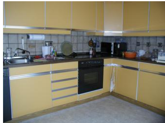
1980-0105b-14 Wohnzimmer m. Fernsehcke 1980-0105b-12 Küche grl

Die Küchenmöbel haben wir vom Vorbesitzer behalten, die waren fast neuwertig.