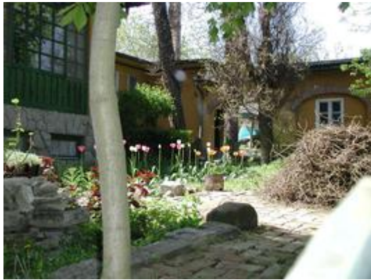
0105e-2a links, Veranda und Küche

Wir hatten eine schöne große Küche, die aber im Winter nicht nutzbar war, weil sie nicht beheizt werden konnte. Allerdings gab es auch einen Räucherofen in der Küche, den man aus dem Keller befeuern konnte, wir haben den aber nie benutzt. Es war wunderbar, im Sommer auf der Veranda zu Mittag zu essen, wir haben dort eine sehr angenehme Zeit verbracht. Unsere drei Zimmer waren auf der Südostseite des Hauses, mit dem Badezimmer, wo wir uns im Winter