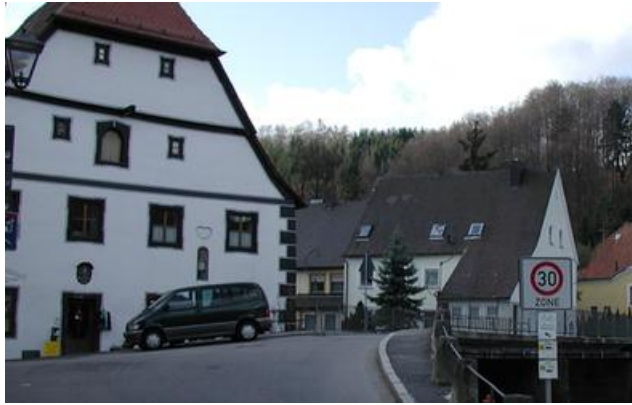
0104b29 Marktpl. Links Nr. 17, rechts Nr. 19