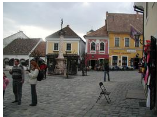
0804d (11) Szentendre Marktplatz hier sind wir immer durchgelaufen, auch zur S-Bahn, der Markt war allerdings nicht hier sondern am Ufer von Bükkös Patak