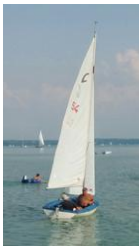
1607vi (3) Boot Vitorlas