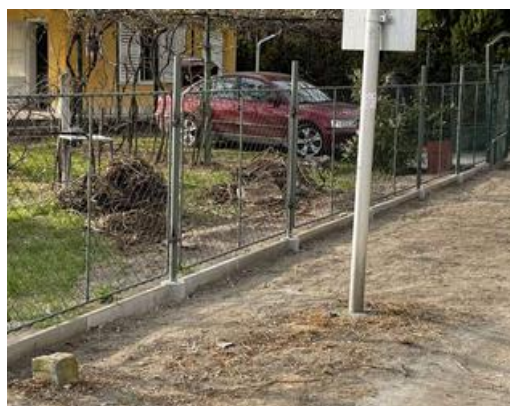
2104ker3 (13) Der neue Zaun in Kenese 2021

Ein großes Problem war, die Sträucher (gle-dicsia) mitsam den Wurzeln zu beseitigen.