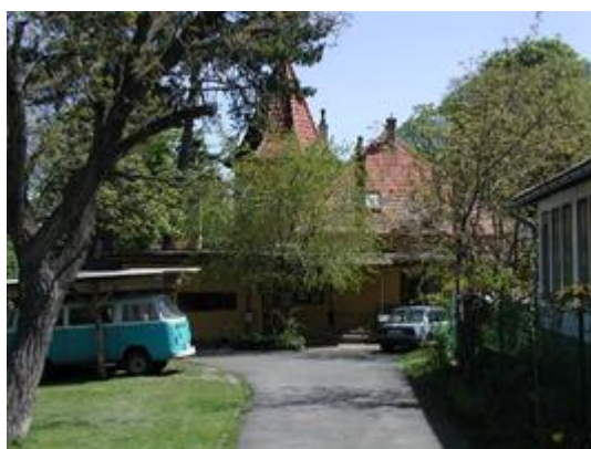
0804d (1) wir wohnten auf der linken Seite 0105e-1a Rückseite des Hauses mit unserer Küche

Wir konnten im Garten auf einer Treppe zum Haupteingang zur Ady Endre utca hinuntergehen, auf dieser sind wir im Winter oft Schlitten gefahren. Aber wir konnten auch vom Friedhof über den Markt zur Hauptstraße rodeln. Schlittschuhlaufen war schwierig, ich musste auf die Kunsteisbahn nach Pest. Zum Skifahren hatten wir keine Möglichkeit, aber wir hatten auch keine Ski. Im Sommer radelten wir viel, meistens mit einem 28“ Zoll Rad mit den Beinen unter dem Rahmen hindurch und wir waren oft an der Donau. Ich habe Hochspringen geübt, mit einem guten Ergebnis, aber später bin ich weit zurückgeblieben.