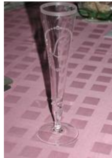
e1b4 Littke Sektglas