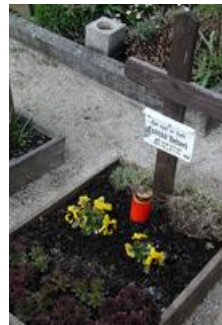
gr1 (5) Grab Fabian

Am 23. April 1977 ist unser zweites Kind Fabian geboren, er war eine Frühgeburt mit 1kg und ist nach 10 Tagen am 03.05.1977 leider verstorben. So blieben wir leider eine kleine Familie, ich hätte gern mehr Kinder gehabt.