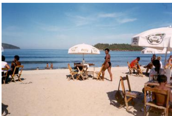
2004apr (1) Strand Pereque

Besonders interessante Kraftwerke waren Buggenum in Holland mit Kohlevergasung, wo ich 5 Jahre war oder CSN bei Rio de Janeiro, wo wir zwei Turbinen in ein Stahlwerk integriert haben, deren Kessel mit Gichtgas befeuert wurden. Brasilien war sehr schön, es gab sehr gutes Essen und die Häuser hatten keine Heizung und keine verglasten Fenster, man hat die Häuser nur mit Fensterläden verschlossen. Dorthin bin ich auch zweimal in den Urlaub hingefahren, nach Pereque am atlantischen Ozean, aber auch zum Zuckerhut in Rio.