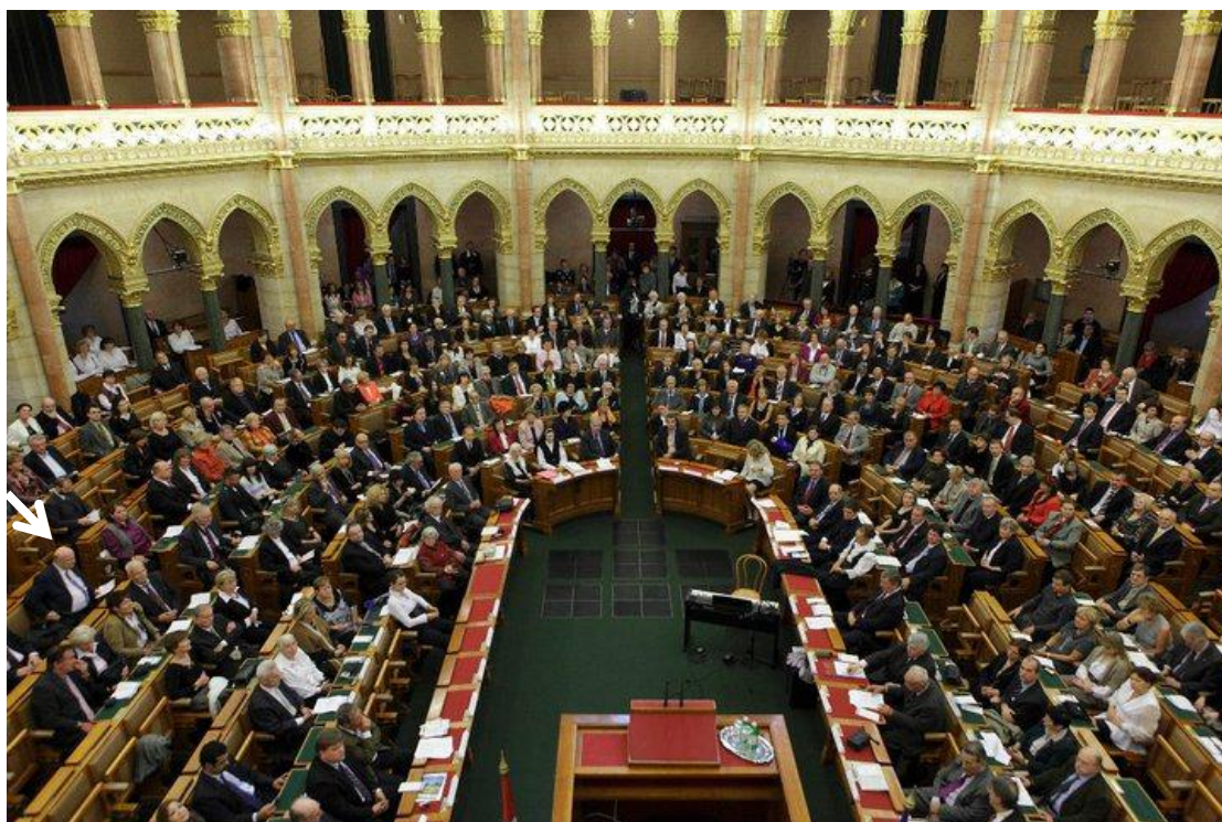
Bild: par2 101022 (8) ich sitze hier links in der 5. Reihe am Rand (siehe weißes Pfeil)

Was mir noch als besonderes Ereignis einfällt ist, dass wir 2014 im ungarischen Parlament eine Feier im Zusammenhang mit unserer Schule in Kastl hatten, an dieser Feier habe ich teilgenommen.