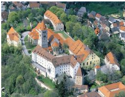
1959-Kastl Foto die Schule aus der Luft

Ich kam 1959 nach Kastl, wo ich 1964 das Abitur gemacht habe. Das waren sehr schöne Jahre.