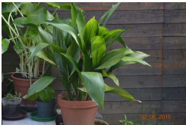
1506a (4) Mais Oma Baja Foto 2015

Zur Freude vom Tobias, habe ich aus Kenese und Debrecen Weinreben-Stecklinge mitgebracht, die jetzt schön in unserem Garten gedeihen und die ich weiter vermehrt habe. So haben wir lebendige Erinnerungen an unsere Vorfahren. Aber ich pflege auch eine Mais ähnliche Pflanze, die bereits im Haus meiner Großeltern in Baja im Jahre 1911 vorhanden war. Seit dem haben wir sie mehrfach umgezogen und immer fleißig gepflegt.