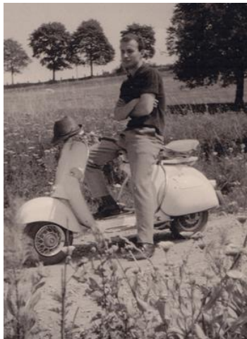
1957ks (12) Vespa Emil 1963