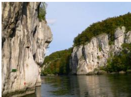
1102c5- Boot Weltenburg Kelheim

Der Donaudurchbruch bei Weltenburg ist von Regensburg aus bis hierhin schiffbar. Das Kloster hat im Innenhof ein Restaurant mit bayrischen Spezialitäten und