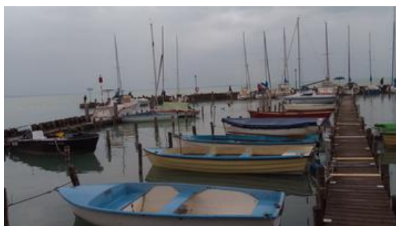
1705kbo (4) Hafen 2017 Angelverein