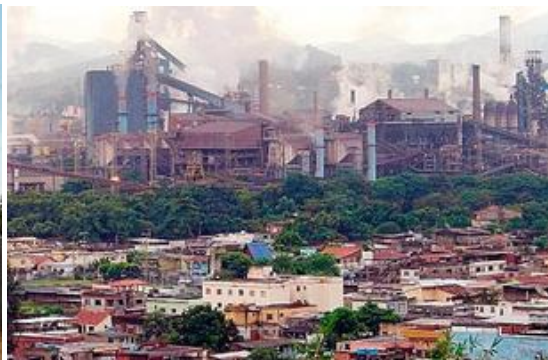
csn 2004apr Volta Redonda bei Rio De Janeiro

Besonders interessante Kraftwerke waren Buggenum in Holland mit Kohlevergasung, wo ich 5 Jahre war oder CSN bei Rio de Janeiro, wo wir zwei Turbinen in ein Stahlwerk integriert haben, deren Kessel mit Gichtgas befeuert wurden. Brasilien war sehr schön, es gab sehr gutes Essen und die Häuser hatten keine Heizung und keine verglasten Fenster, man hat die Häuser nur mit Fensterläden verschlossen. Dorthin bin ich auch zweimal in den Urlaub hingefahren, nach Pereque am atlantischen Ozean, aber auch zum Zuckerhut in Rio.