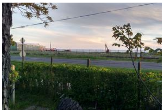
1705kk Kenese Aussicht zum Balaton