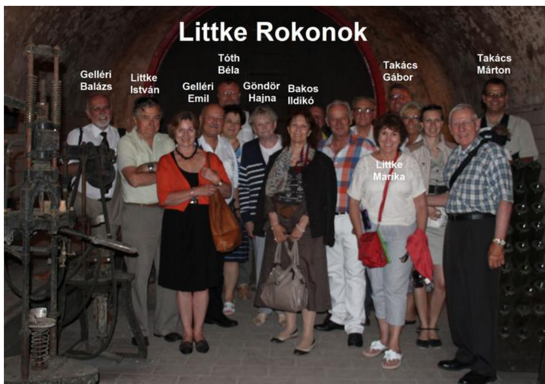
1c p0 1306pk (47)z2t Littke Verwandschaft im „pezsgöház“

entstanden. Deshalb finde ich es wichtig immer gute Kontakte zu pflegen und dann im Alter über die schönen Erinnerungen zu plaudern.