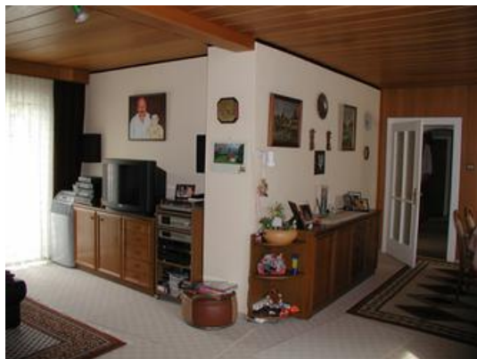
1980-0105b-15 Wozi grl Wohnzimmer