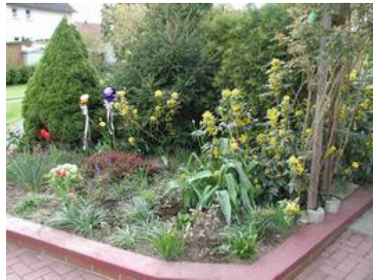
0104-a01 grl Garten vorne mit Blumen