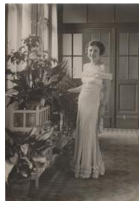
sd33a Sany 1935 Barcs mit Mais

Auf dem Bild der Mais 1935 zusammen mit Sany in Barcs in ihrer Wohnung im Gerichtsgebäude. Sie hat erzählt, dass sie die Pflanze schon 1911 in Baja hatten.