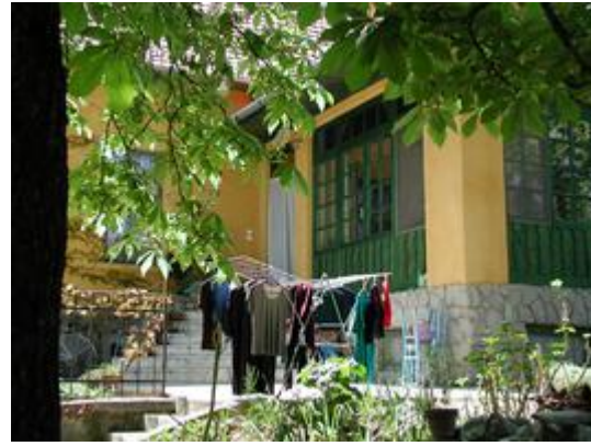
0105e-1d Veranda, wo wir im Sommer aßen