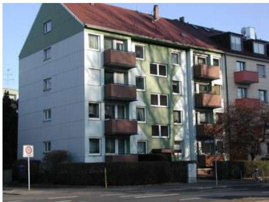
wels-0512c (2) Wohnung Welsersstr. unten rechts