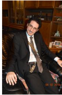
2012we (2) Tobi 2020