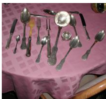
e1b1 Komlossy Silberbesteck