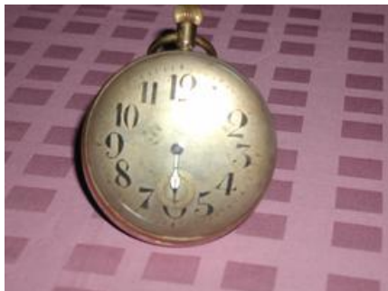
1b3 Glasuhr Rimler Uhr

Jetzt habe ich noch einige Bilder, die ich keinem Thema mehr zuordne und hier einfach hintereinander stelle, weil ich sie gern zeigen möchte .