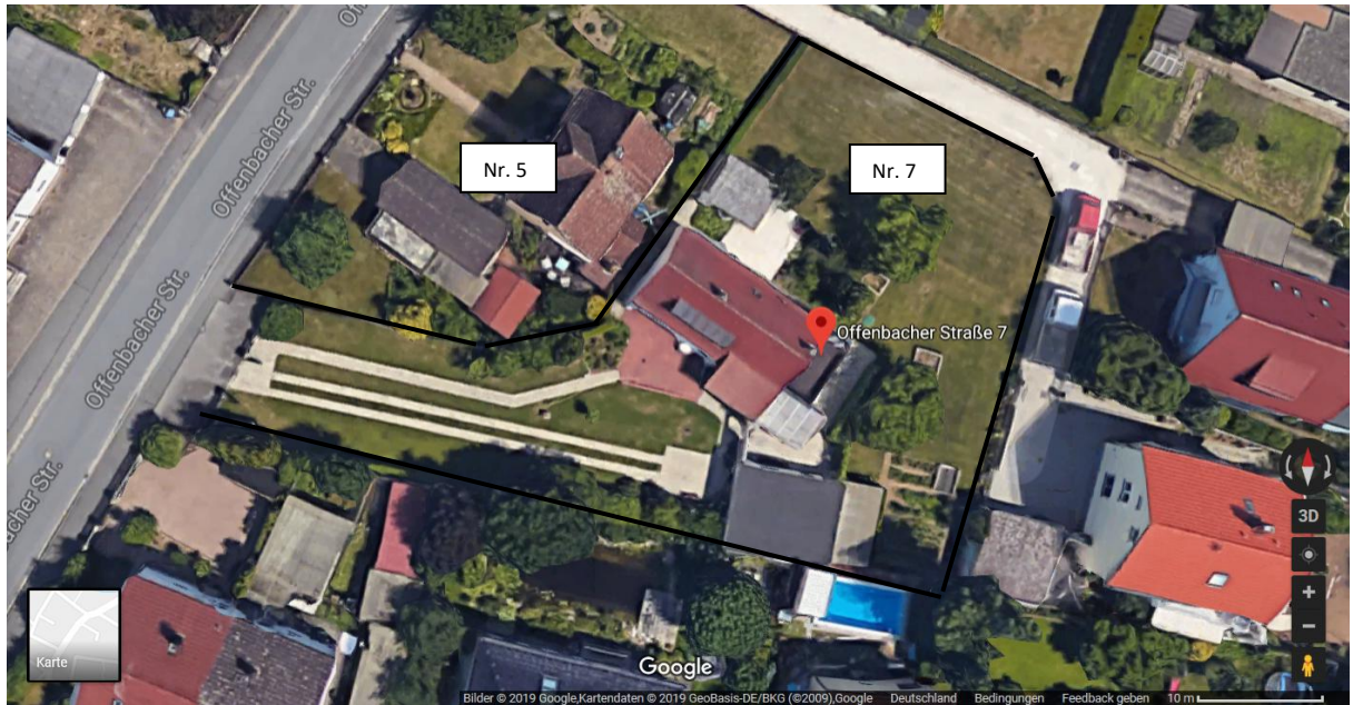
Grl 190204 Google Map Gross, uns gehört vorne die Einfahrt mit Garage und hinten der Garten bis zum Weg