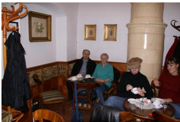
0911b (3) gute Francia Kremes

Auf dem Bild der Mais 1935 zusammen mit Sany in Barcs in ihrer Wohnung im Gerichtsgebäude. Sie hat erzählt, dass sie die Pflanze schon 1911 in Baja hatten.