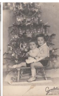
Sanya1 (22b 1949 und 17b) Szentendre