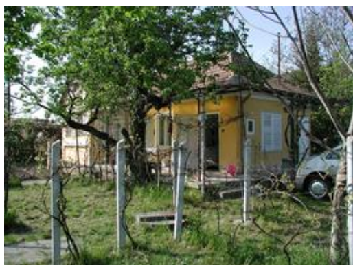
k-0105k-41 Kenese Häuschen