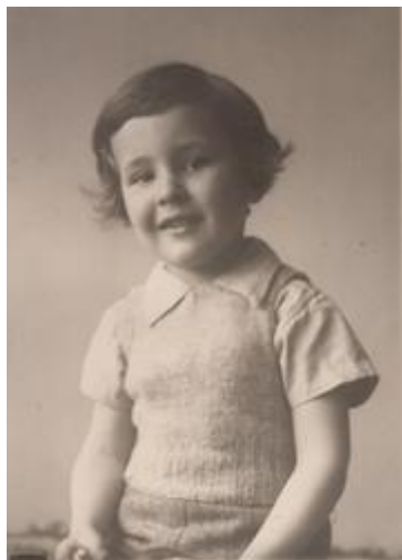
Sanya1 (22a) Emil 1949

Die Donau war wunderbar für uns, wir wohnten in der Nähe und haben oft neben dem Papsziget gebadet, hier haben wir den kleinen Seitenarm durchschwommen und waren sehr stolz auf diese Leistung. In diesem Flussbett wurde während des Krieges ein Lastkahn versenkt, bei dem die Soldaten jeden Tag eine Granate gezündet haben, weil sie so viele Fische fangen konnten.