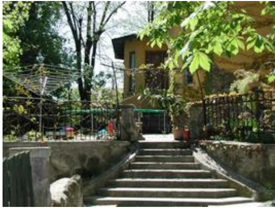
0105e-1c Terasse links verglastes Zimmer