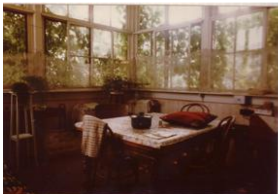
1980-k05 Veranda, wo wir im Sommer gegessen haben, manchmal Backhähnchen, die wir lebendig am Markt gekauft haben