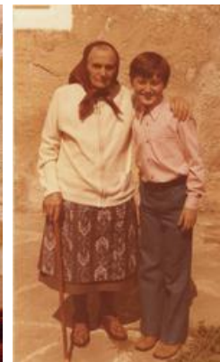
1972s Oma, Oli